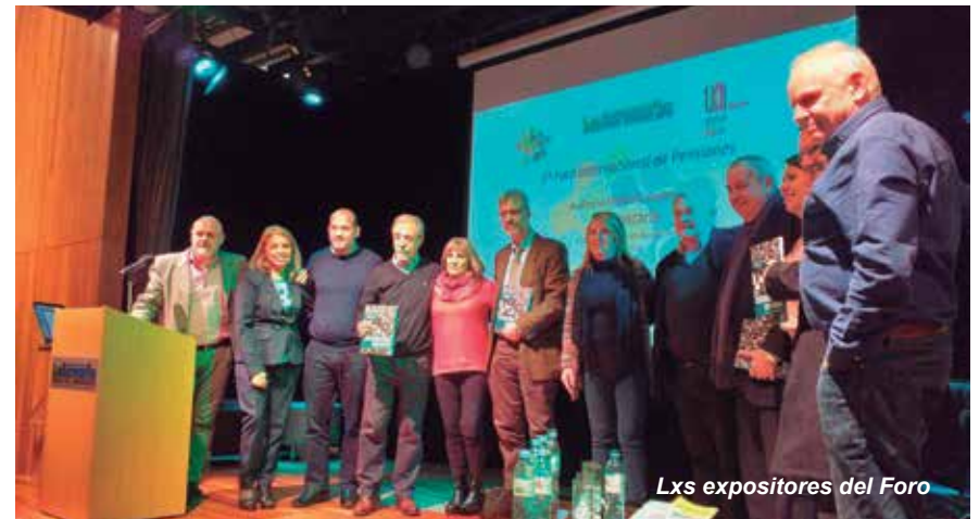
Lxs expositores del Foro